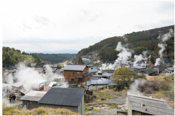
わいた地区の湯煙の様子