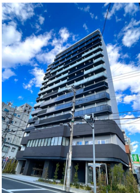
カレッジコート国分寺

東京ガス不動産株式会社（社長：穴水 孝、以下「東京ガス不動産」）は、このたび、「カレッジコート国分寺（121戸）」「ラティエラアカデミコ三鷹（231戸）」の2棟 352戸の学生寮を新たに供給します。両物件で、東京ガス不動産が供給する賃貸住宅の累計は、32棟、2,041戸となります。なお、東京ガス不動産が学生寮を開発するのは初めてです。