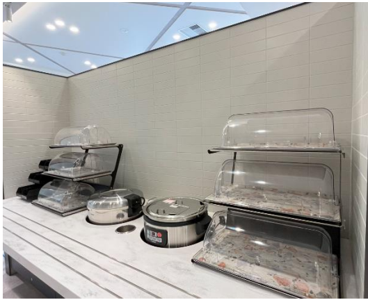
食堂の配膳スペースの壁タイルとして活用 (カレッジコート国分寺)