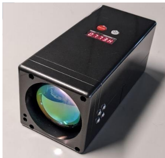
遠隔 R32 検知器の試作機