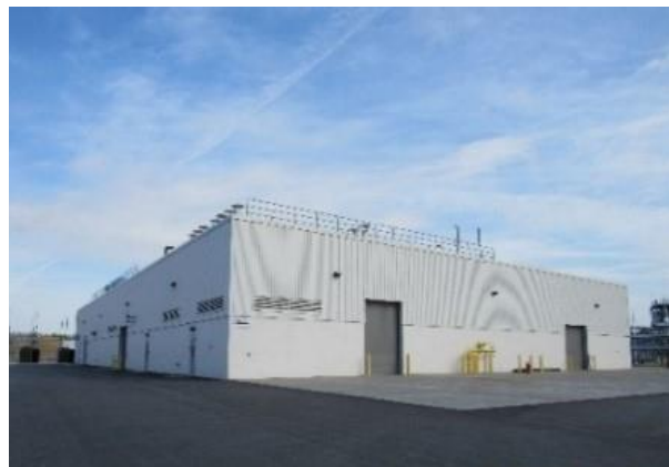
TGES アメリカ エネルギープラント外観

TGES アメリカは、2016年10月より、スパルタンバーグ工場に対して、工場に隣接するエネルギープラントにユーティリティ設備を設置し、蒸気・冷水・冷却水・純水・圧縮空気を供給するとともに、エネルギープラント建屋の設計から建設、設備運用、メンテナンスまで一括して担当する総合的なユーティリティサービス事業を行っています*1。今回のサービス拡大は、CMA のスパルタンバーグ工場の生産増強計画*2に対応するもので、TGES アメリカがユーティリティ設備を増設し、2025年から供給を開始する予定です。