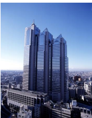
新宿パークタワー