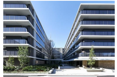
ラティエラ武蔵小杉