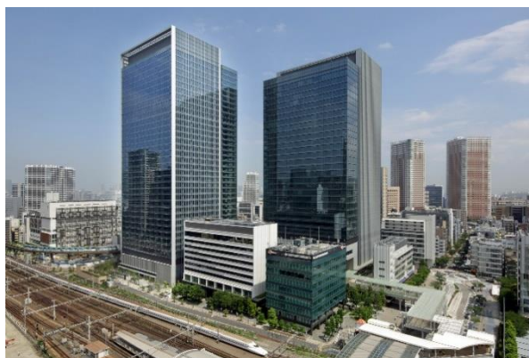
msb（ムズブ）田町ステーションタワー-N