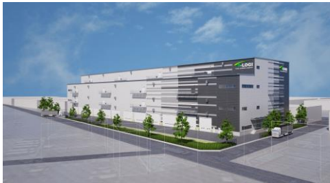
東京建物株式会社との共同事業 (仮称) T-LOGI 鶴ヶ島