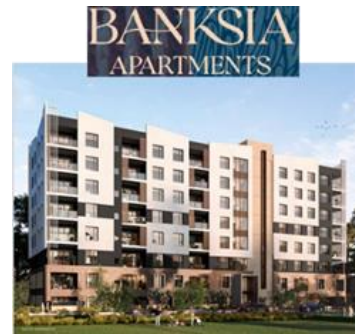
オーストラリアでの不動産開発事業 「BANKSIA」外観イメージ