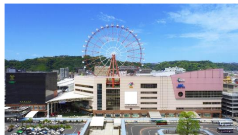
アミュプラザ鹿児島