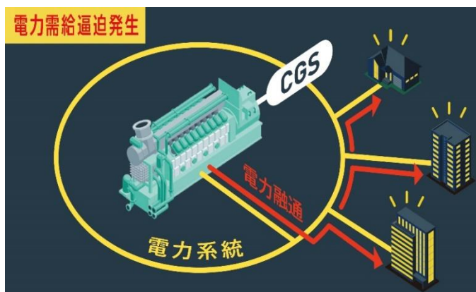
電力需給逼迫解消に貢献