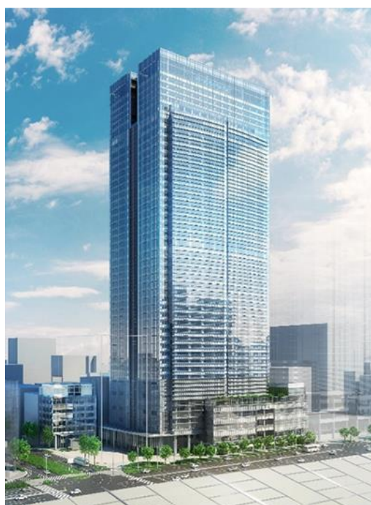
東京ミッドタウン八重洲 完成予想