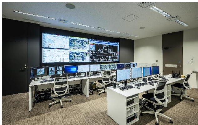
中央監視室の EMS イメージ図