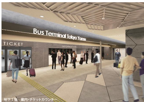
バスターミナル東京八重洲(CG)

現下、電力需要が高まる夏季・冬季における電力需給逼迫が見込まれています。本プロジェクトは、分散型電源である CGS の発電により平常時から系統電力の負荷を軽減し、電力需給バランスの安定化に寄与します。さらに、電力需給逼迫時に系統からの要請があった際には、CGS の発電電力を八重洲エリアに供給した上で、余った電力を系統に融通することで、電力需給逼迫の解消に貢献します。