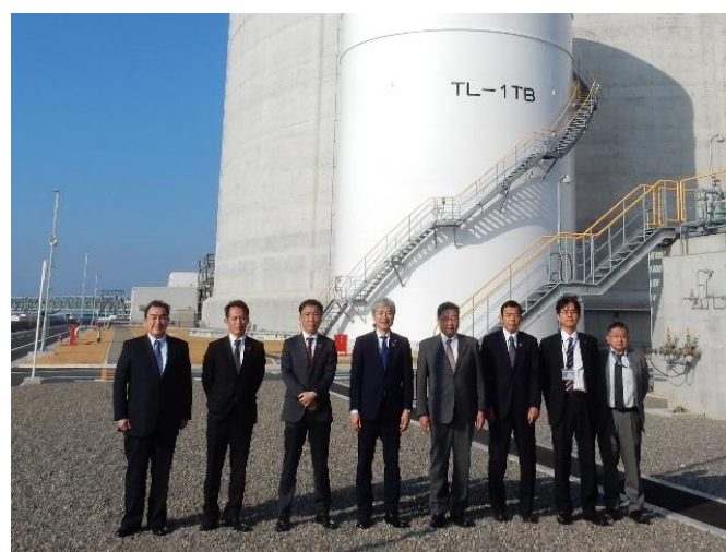
新居浜LNG及び株主各社の幹部