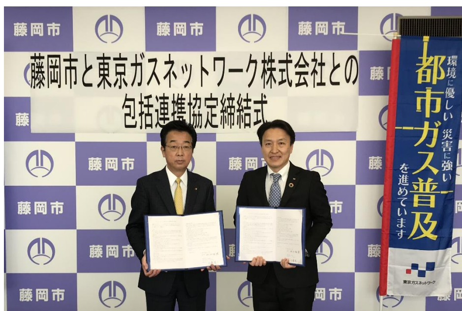
左から 藤岡市：新井雅博市長、東京ガスネットワーク：佐藤隆一群馬支社長

本協定は、藤岡市と東京ガスネットワークが相互に連携のもと、2者の知見や技術を活かし、「ゼロカーボンシティ実現」を目指すものです。