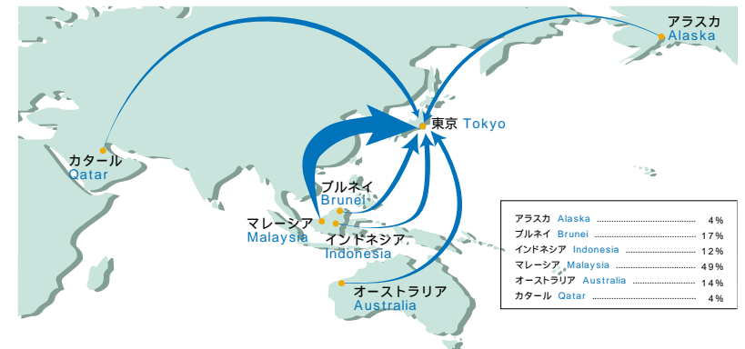
東京ガスにおけるLNG供給体制 Tokyo Gas LNG Imports