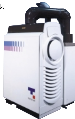
マイクロタービンと排熱回収装置を組み合わせたコージェネレーションパッケージ

病院等の民生用にいたるまで幅広く導入されています。当社は、長年にわたってコージェネレーションの技術開発に努めてきており、システムに関するノウハウやエンジニアリング力では、国内はもとより世界でもトップクラスであると自負しています。また、昨今は大規模発電から分散型電源への流れが加速しておりますが、その分野での注目株であるマイクロタービンについても、当社ではコージェネレーションとしてのパッケージ・商品化に取り組んでおり、中小規模の病院、ホテル、コンビニエンスストアやファーストフードレストランを中心に、2001年頃から本格的に普及していくのではないかと予測しています(なお、このマイクロタービンについては、中期経営計画における2,500億円のフリーキャッシュフロー創出には含まれていません)。さらに、その先の武器として期待しているのが家庭用燃料電池コージェネレーションです。これは各家庭で都市ガスを燃料として、水素製造装置によりつくられた水素を使って固体高分子型燃料電池(PEFC)で発電し、同時に給湯・暖房を行うものです。当社は、5年後の導入開始、10年後の本格的普及を目標に、すでにその開発に取り組んでいます。この燃料電池は一般家庭に設置することを目標としており、現在の家庭用需要件数が約800万件であることを考慮すれば、その市場の巨大さをご理解いただけたと思います。