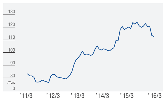
Source: 10:00 am TTS quotation from Bank of Tokyo-Mitsubishi UFJ 出典:三菱東京UFJ銀行の10:00AM発表の対顧客電信売相場