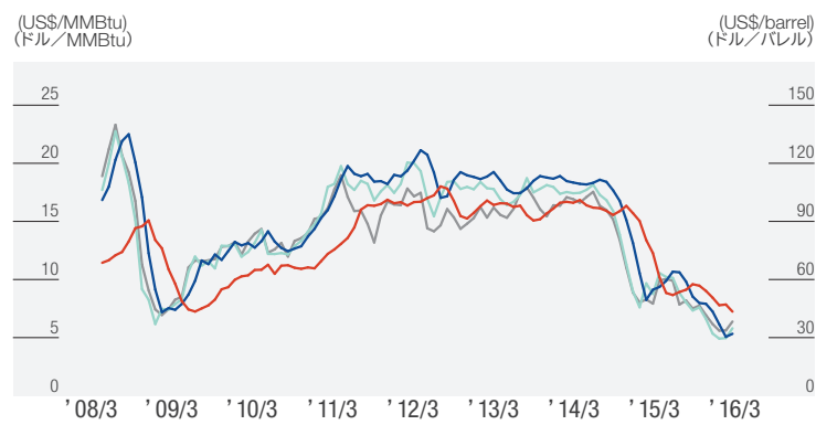
— All Japan LNG Prices (Trade statistics) (US$/MMBtu) 全日本LNG(貿易統計値)(ドル/MMBtu) — JCC Prices (Trade statistics) (US$/barrel) 全日本原油(貿易統計値)(ドル/バレル) — Dubai (US$/barrel) ドバイ(ドル/バレル) — WTI (US$/barrel) WTI(ドル/バレル) Source: Compiled by Tokyo Gas from various materials 出所:各種資料より当社作成