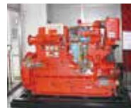
天然ガス コージェネレーション初号機