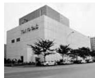
旧新宿地域冷暖房センター