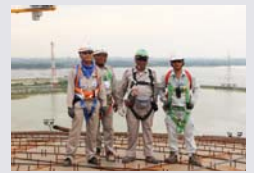
タイ マブタプット LNG基地拡張工事