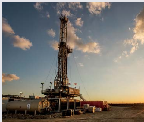
バーネットシェールガス開発

天然ガス需要の高まりが見込まれる東南アジアでは、各国政府や企業と連携し、LNG受入基地事業、ガス火力発電事業、ガス配給事業、エネルギーサービス事業などの中下流事業に取り組み、当該国でのエネルギーチェーンの構築、展開を目指します。