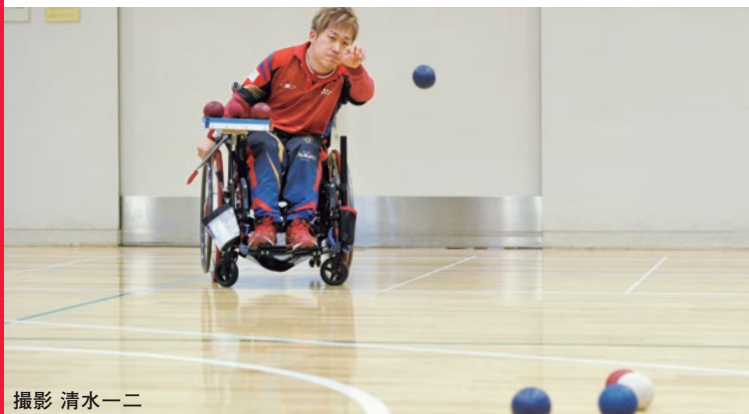
撮影 清水一ニ ボッチャ体験