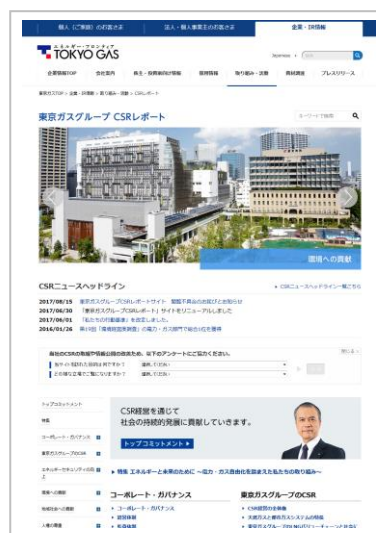
「東京ガスグループ CSR レポート WEB版」