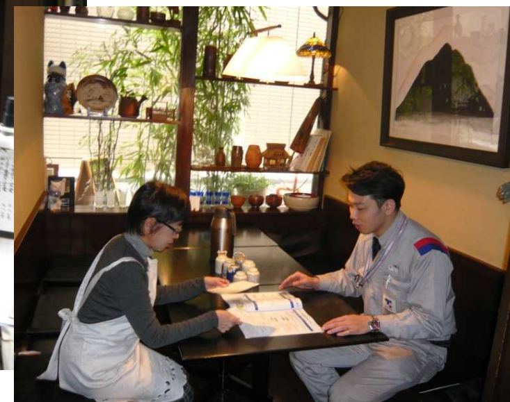
『港区 日本料理 えんの里』様 ご提案の様子

お客さまからいただいたご意見・ご要望（特にご不満点）については、 真摯かつ迅速に対応していくとともに、グループ内で共有化・再徹底を図っています。