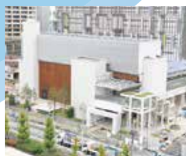
田町駅東口北地区1街区 第1スマートエネルギーセンター