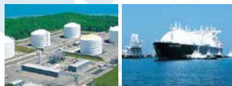
コープポイントLNG プロジェクト