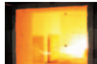
リジェネレイティブ バーナシステム