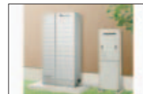
家庭用燃料電池「エネファーム」