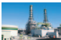
川崎天然ガス発電