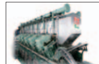
コージェネレーションシステム